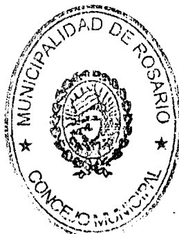
Cjal. Miguel Zamarini Presidente Concejo Municipal de Rosario