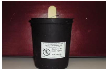
Figura 1: Ovitrapa

Se instala en un sitio adecuado, próximo a viviendas particulares u edificios con jardín o patio. Normalmente, se controlan una vez a la semana y se revisan las paletas para detectar la presencia de huevos de Aedes aegypti .