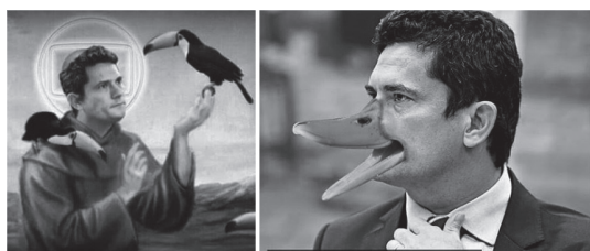
Figura 3. Sergio Moro.

Parte de la efectividad del meme como herramienta política para sentar posiciones se encuentra en su carácter de transgredir lo establecido y subvertir, en mayor o menor grado, el orden. En este sentido, encontramos similitudes con la caricatura, tal como ha sido formulado por Burkart, “[l]a caricatura se caracteriza por exagerar, “cargar” y deformar, rebajar y desenmascarar” (2014, p. 2). La autora recupera de Freud la acción de “volver cómica a una persona para hacerla despreciable, para restarle títulos de dignidad y autoridad”, lo que produce “un sentimiento de superioridad tanto en el productor como en el consumidor de estas imágenes” (Bukart, 2014, p. 2). Según Soler, la capacidad de transgredir está asociada a que, en determinado contexto político, los sujetos se atreven a reírse incluso de imágenes o figuras que hasta entonces habían sido inmaculadas (Soler, 2015, p. 42).