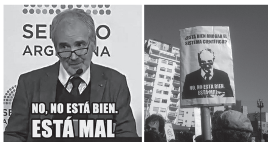
Figura 5. Kornblihtt.

Como mencionamos, los memes tienen la capacidad de sintetizar ideas y climas políticos y de ser rápidamente comprendidos por quienes los ven, siempre que compartan los códigos necesarios para descifrarlos. Tal fue el caso del meme ubicado a la izquierda en la Figura 5, surgido durante los debates en torno a la legalización de la Interrupción Voluntaria del Embarazo (ILE) que tuvieron lugar en Buenos Aires en mayo y junio de 2018. En ese contexto, una serie de figuras reconocidas de los campos científico, artístico, intelectual y de los movimientos sociales participaron prestando sus argumentos a